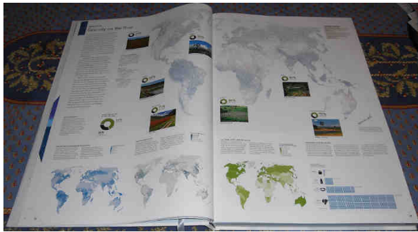
Figure 17.1. Page d'un atlas géographique national avec des cartes, des diagrammes et des photographies